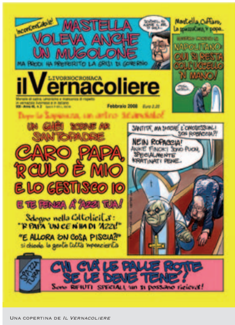
UNA COPERTINA DE IL VERNACOLIERE